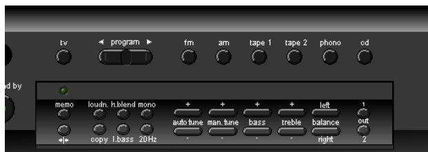
Bedienebenen für Sekundärfunktionen und...